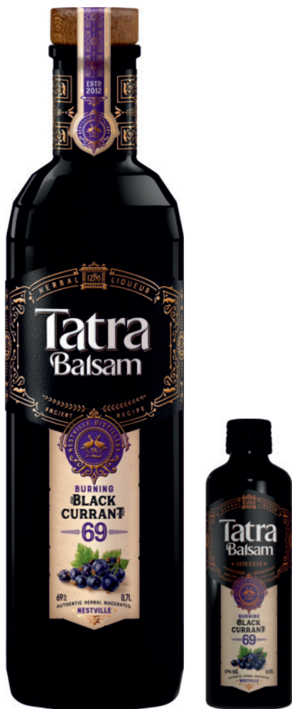
Tatra Balsam Czarną porzeczką 69%