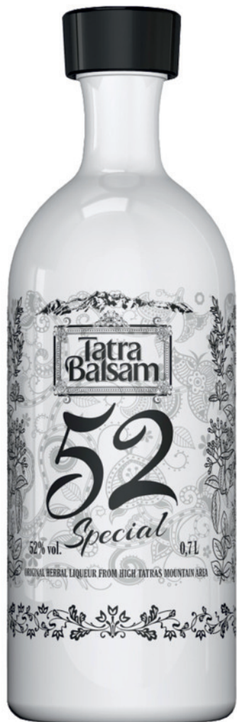
Tatra Balsam Specjalny Ceramiczny 52%