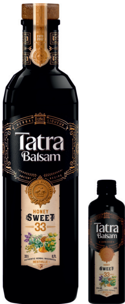
Tatra Balsam Słodki 33%