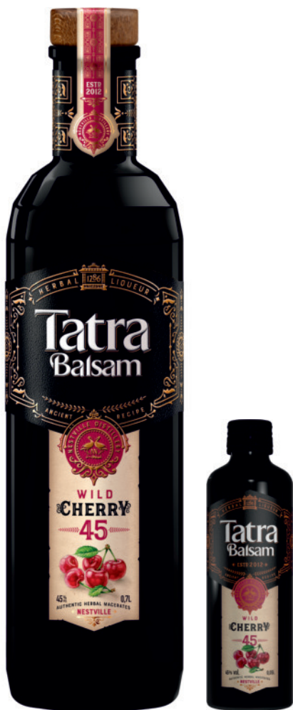
Tatra Balsam Wiśniowy 45%