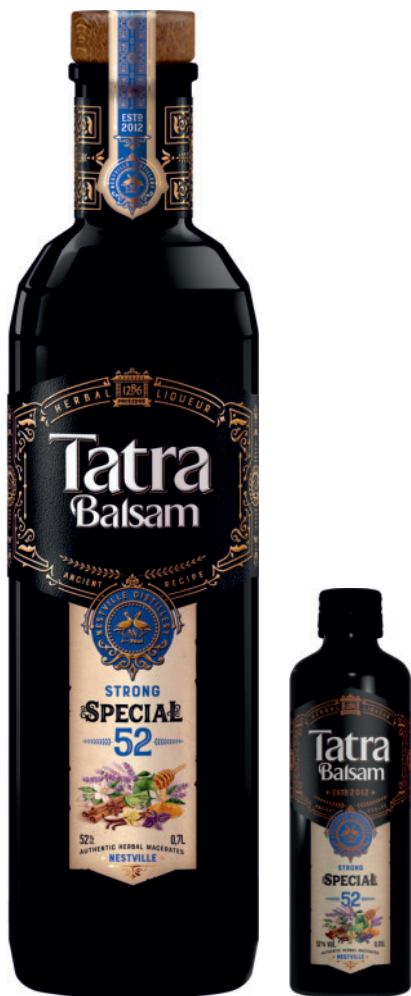
Tatra Balsam Specjalny 52%