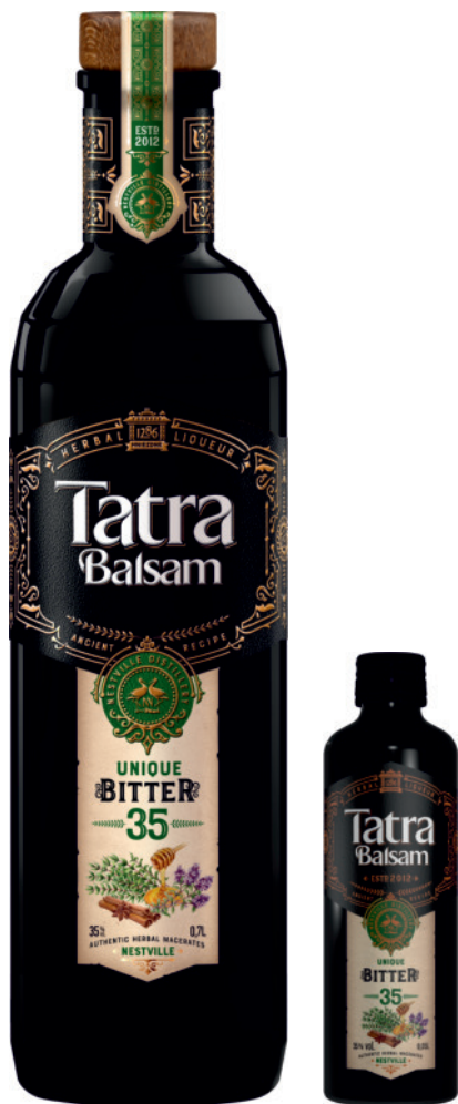
Tatra Balsam Gorzki 35%