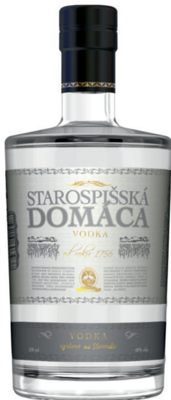
Starospišská Domáca Wódka 40%