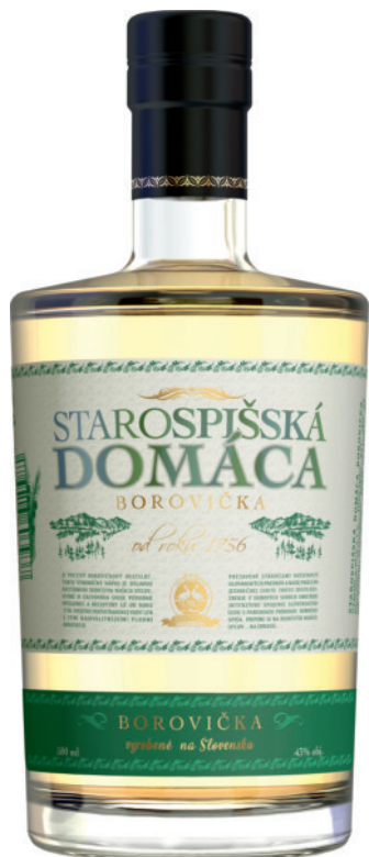
Starospišská Domáca Boroviczka 43%