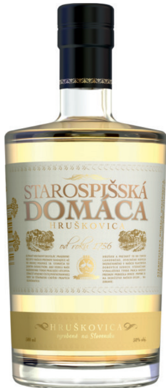
Starospišská Domáca Gruszkówka 50%