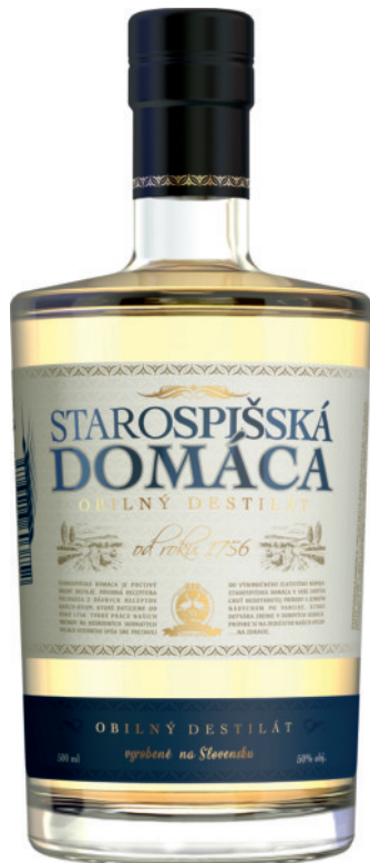
Starospišská Domáca Zbožowa 50%