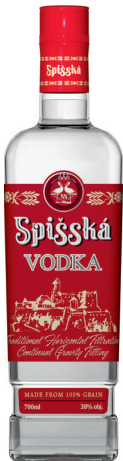
Spišská Vodka 38%