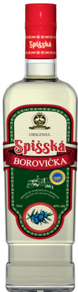
Spišská borovička 40%