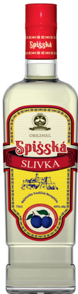
Spišská Šlivka 40%