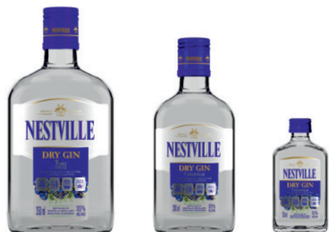
Nestville Dry Gin 37,5%