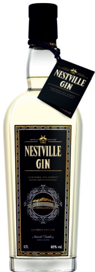
Nestville Gin 40%