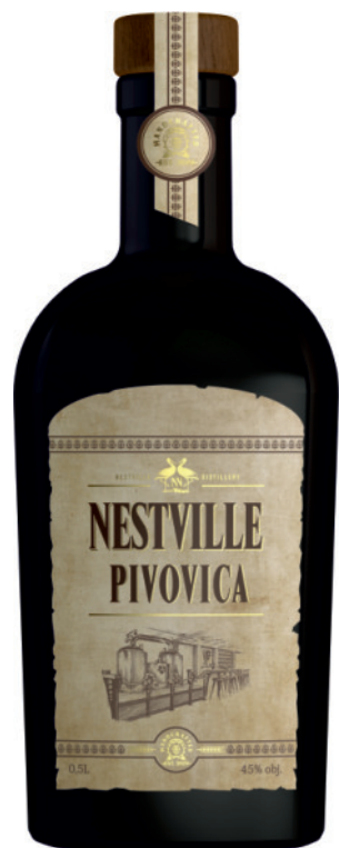
Nestville Pivovica 45%